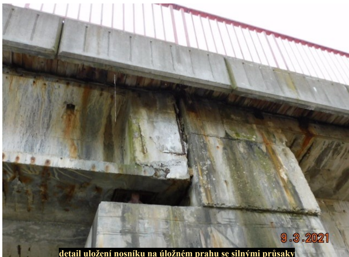
detail uložení nosníku na úložném prahu se silnými průsaky