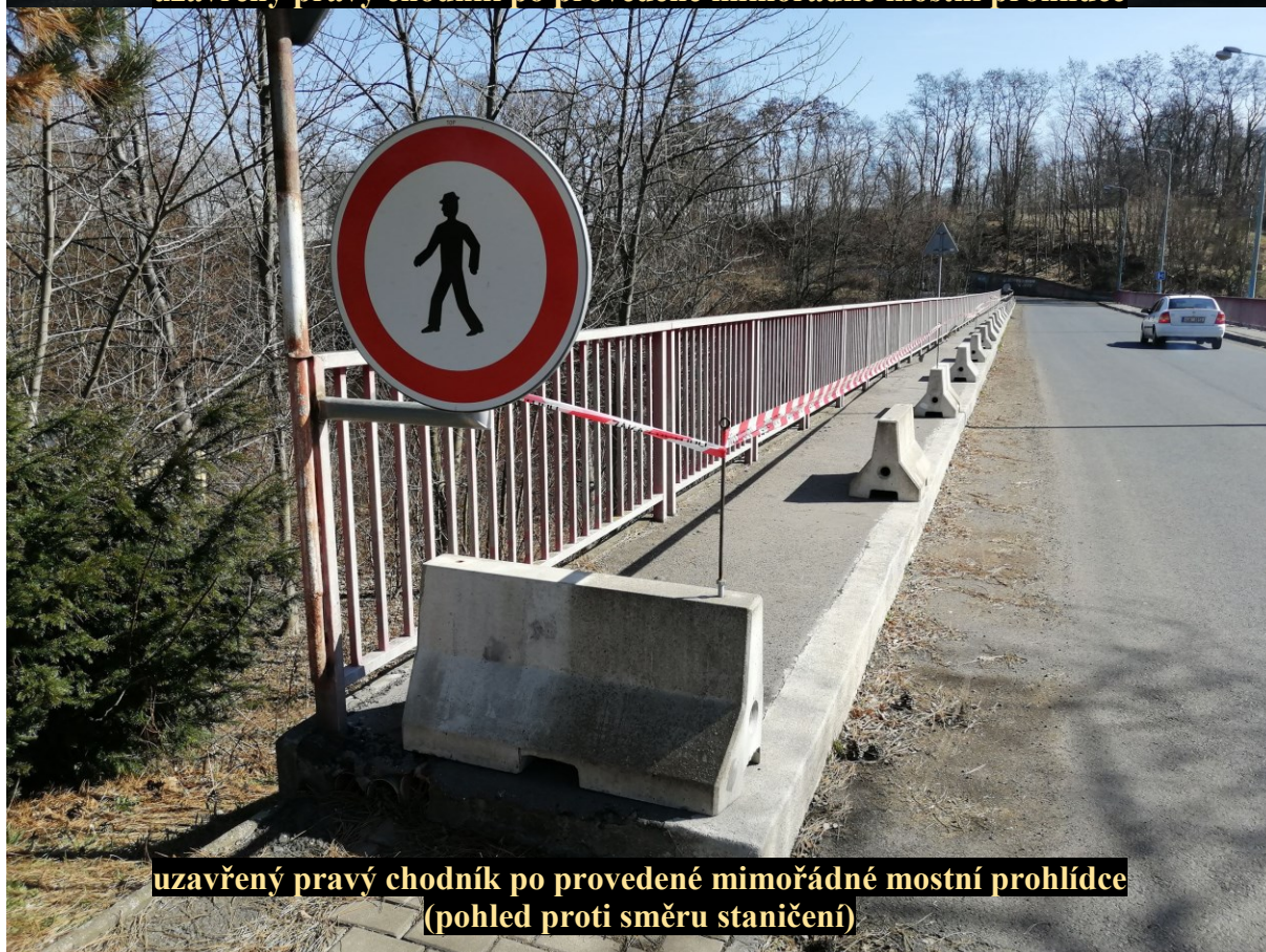
uzavřený pravý chodník po provedené mimořádné mostní prohlídce (pohled proti směru staničení)