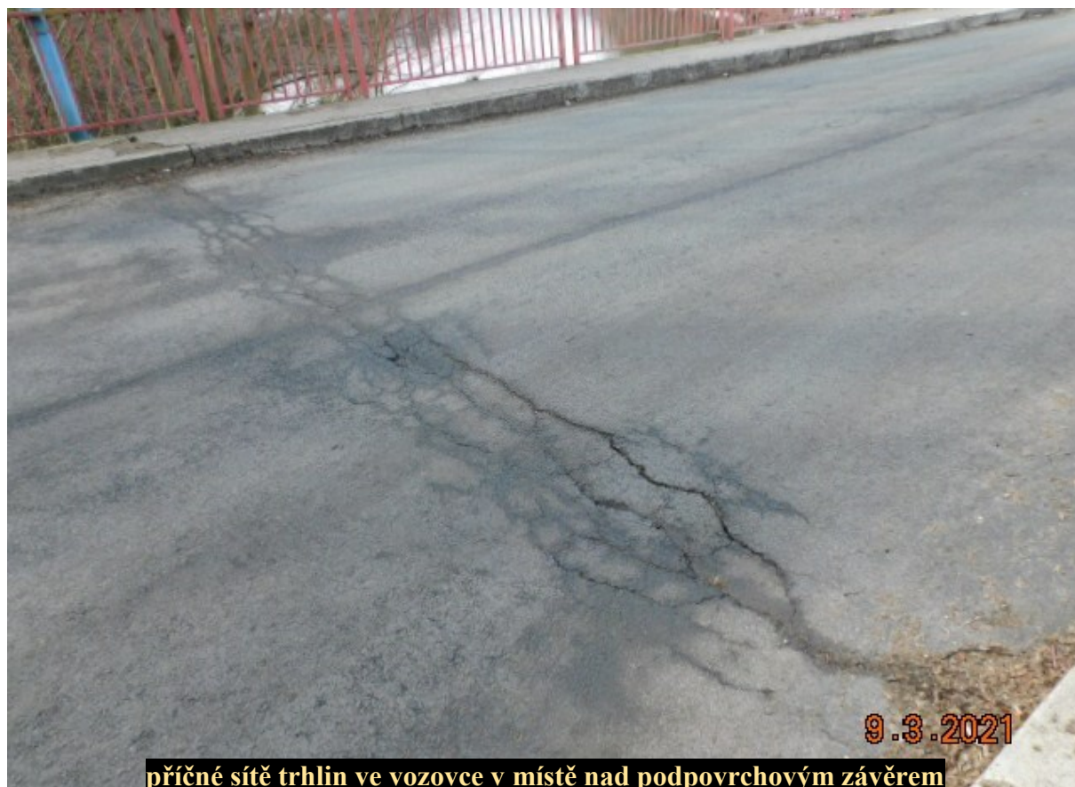
příčné sítě trhlin ve vozovce v místě nad podpovrchovým závěrem