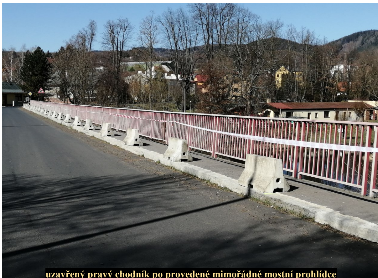
uzavřený pravý chodník po provedené mimořádné mostní prohlídce