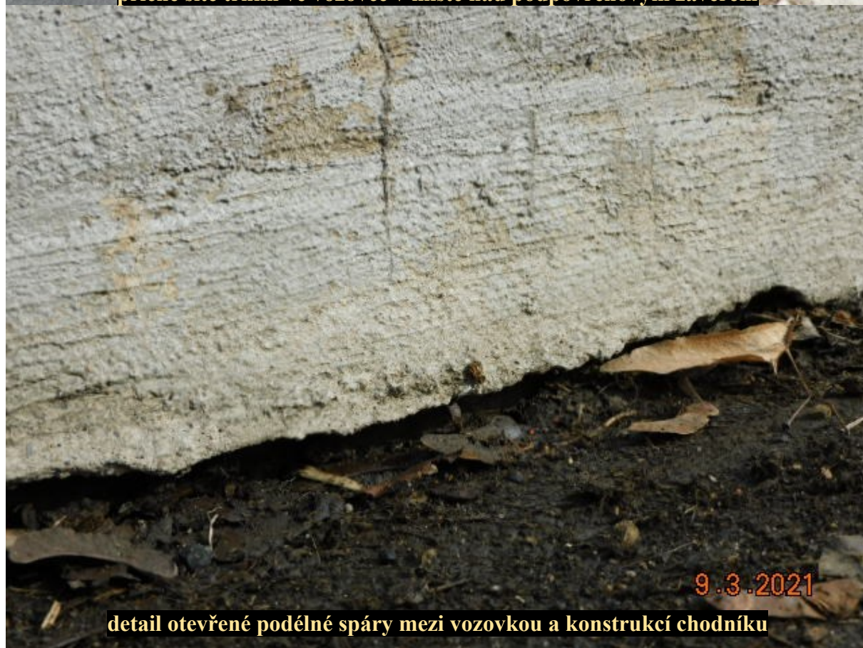
detail otevřené podélné spáry mezi vozovkou a konstrukcí chodníku