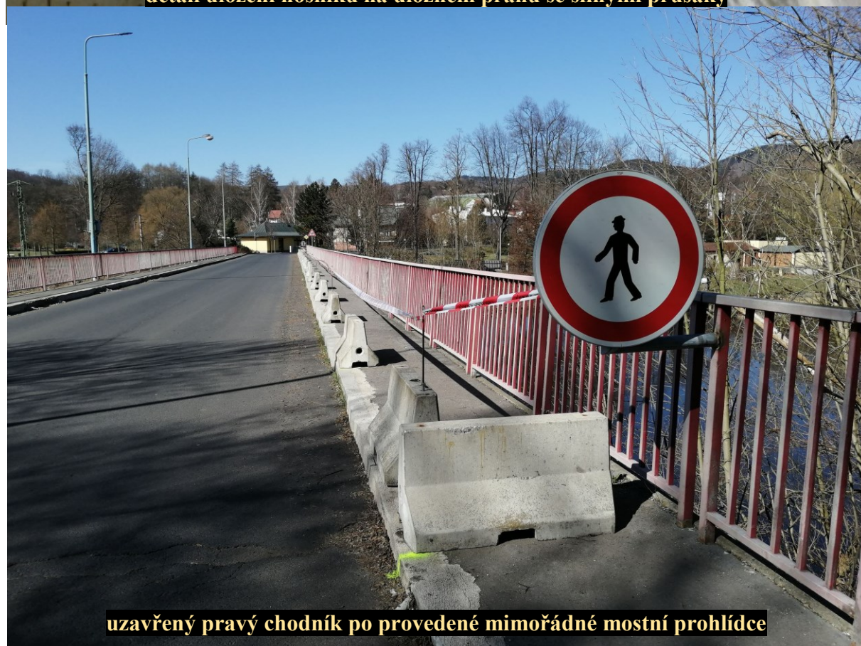
uzavřený pravý chodník po provedené mimořádné mostní prohlídce