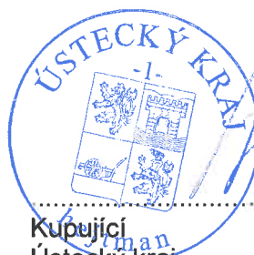
Kupující Ústecký kraj Oldřich Bubeníček, hejtmán Ústeckého kraje