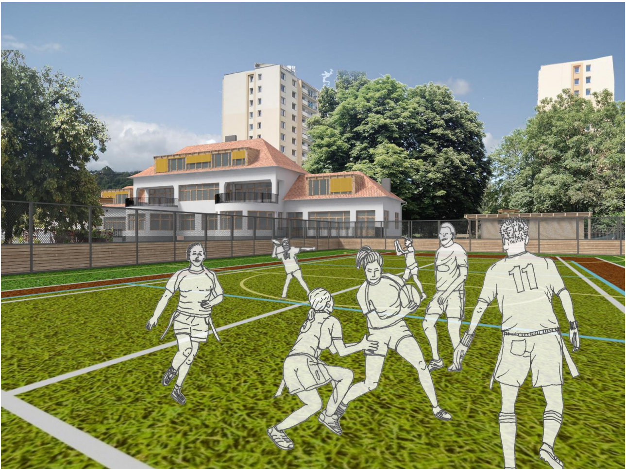
Vizualizace hřiště (pouze ilustrační – ve skutečnosti bude odlišný povrch)