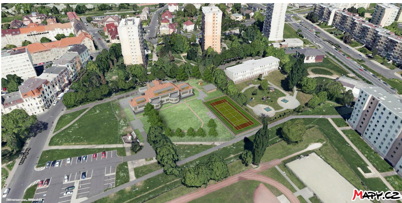
Ilustrační vizualizace hřiště v celkovém rozvrhu stavby