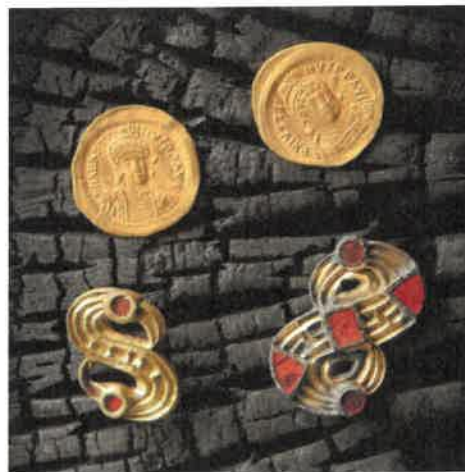
Ukázka komorového hrobu a části pohřební výbavy, zlatých mincí a šatních spon z Nezabylic, okr. Chomutov.

Také v roce 2023 byla rozvíjena oblast mezinárodní spolupráce a to pokračováním úspěšné spolupráce s Univerzitou v polském Rzesowě, která se týká záchranného archeologického výzkumu pohřebiště z doby římské v Nezabylicích. Každým rokem tento záchranný výzkum ohroženého pohřebiště z 1. a 2. století našeho letopočtu přináší velice cenné poznatky o starší době římské v severozápadních Čechách. Tento výzkum je realizován pod vedením naší instituce a kromě zmíněné univerzity se na něm podílí i Oblastní muzeum