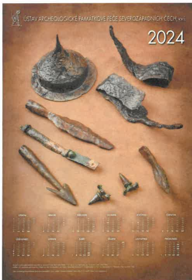
Zbraně a výstroj z hrobů pohřebiště v Nezabylicích, 1.–2. stol. n. l.

v Chomutově za podpory Ústeckého kraje. V rámci tohoto výzkumu proběhl každoroční studijní pobyt a praxe polských studentů archeologie.