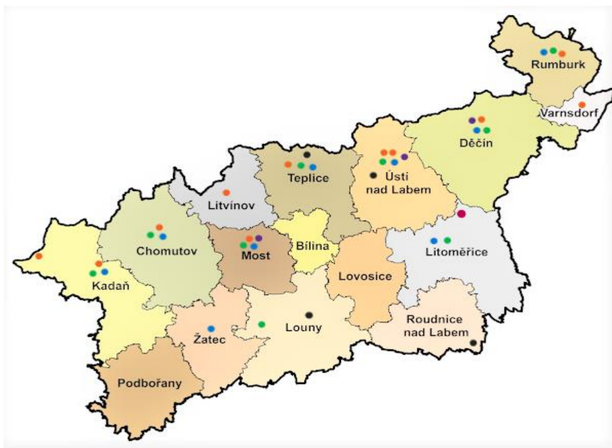
Obrázek 6: Grafické znázornění rozložení adiktologických služeb v Ústeckém kraji

Aktuální stav, potřeby a nedostatky v jednotlivých oblastech prevence jsou popsány v Akčním plánu v úvodních kapitolách zabývajících se současnou situací.