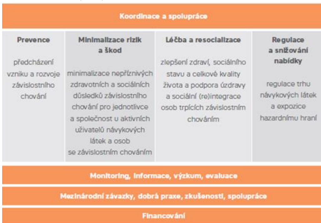
Obrázek 1: Struktura politiky v oblasti závislosti