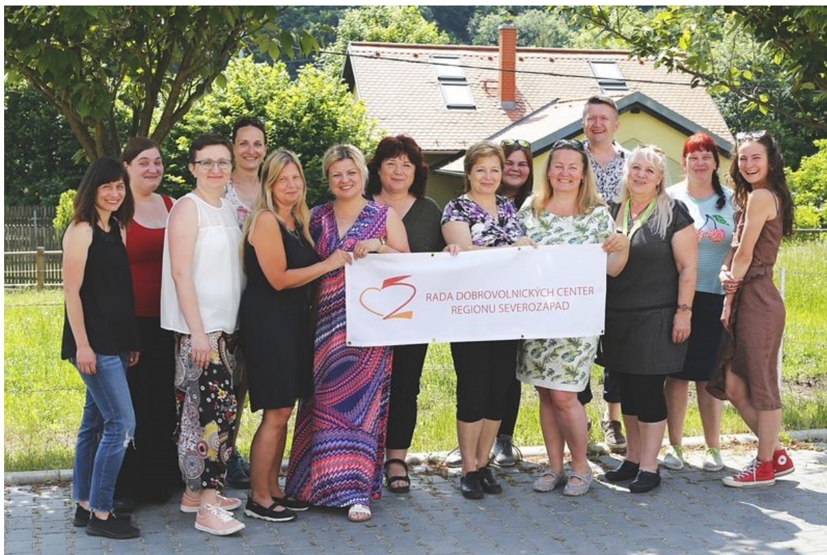
Obrázek 1: Fotografie zástupců členských organizací a hostů zasedání.