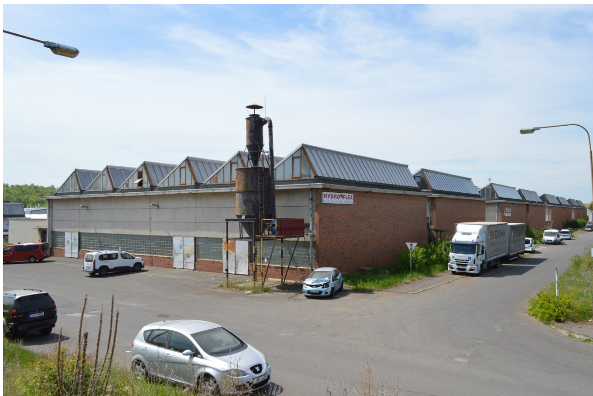
Pohled na průčelí a boční část hal od severovýchodu.