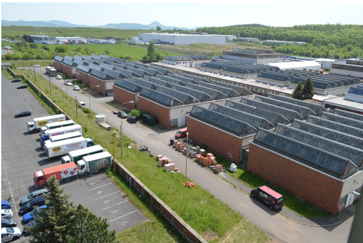
Celkový pohled na trojici halových modulů perspektivních pro Centrální depozitář ÚK.