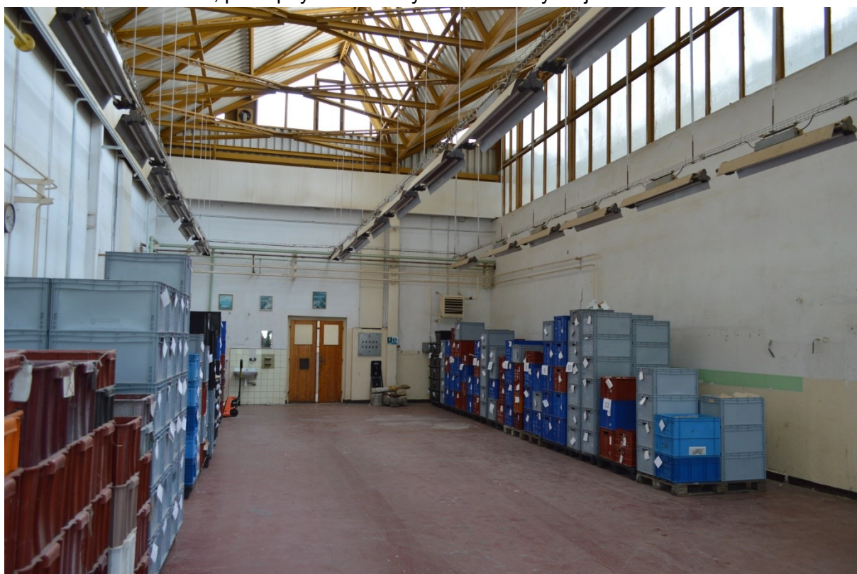
Pohled do interiéru hal, přístupných z chodby a samostatným vjezdem z okolní komunikace.