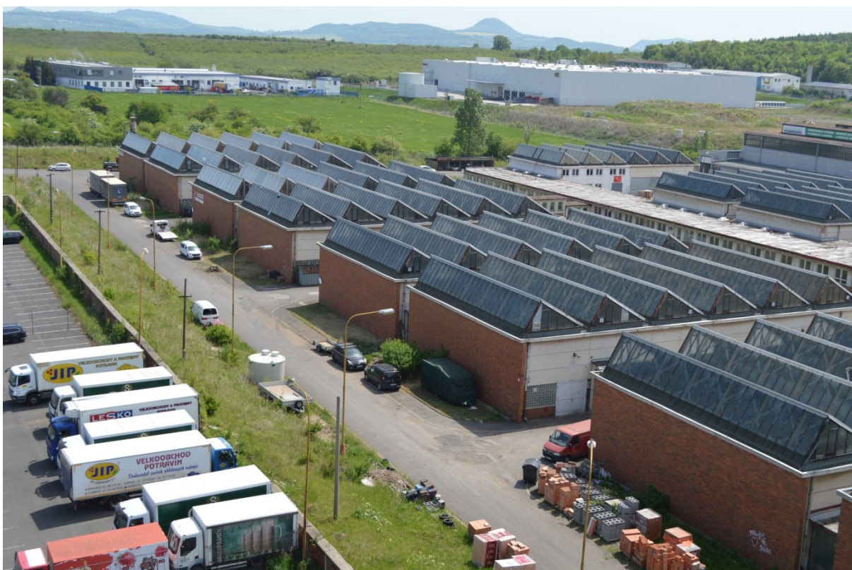
Detail trojice halových modulů.