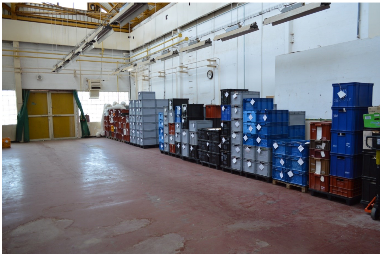
Pohled do interiéru hal, přístupných z chodby a samostatným vjezdem z okolní komunikace.