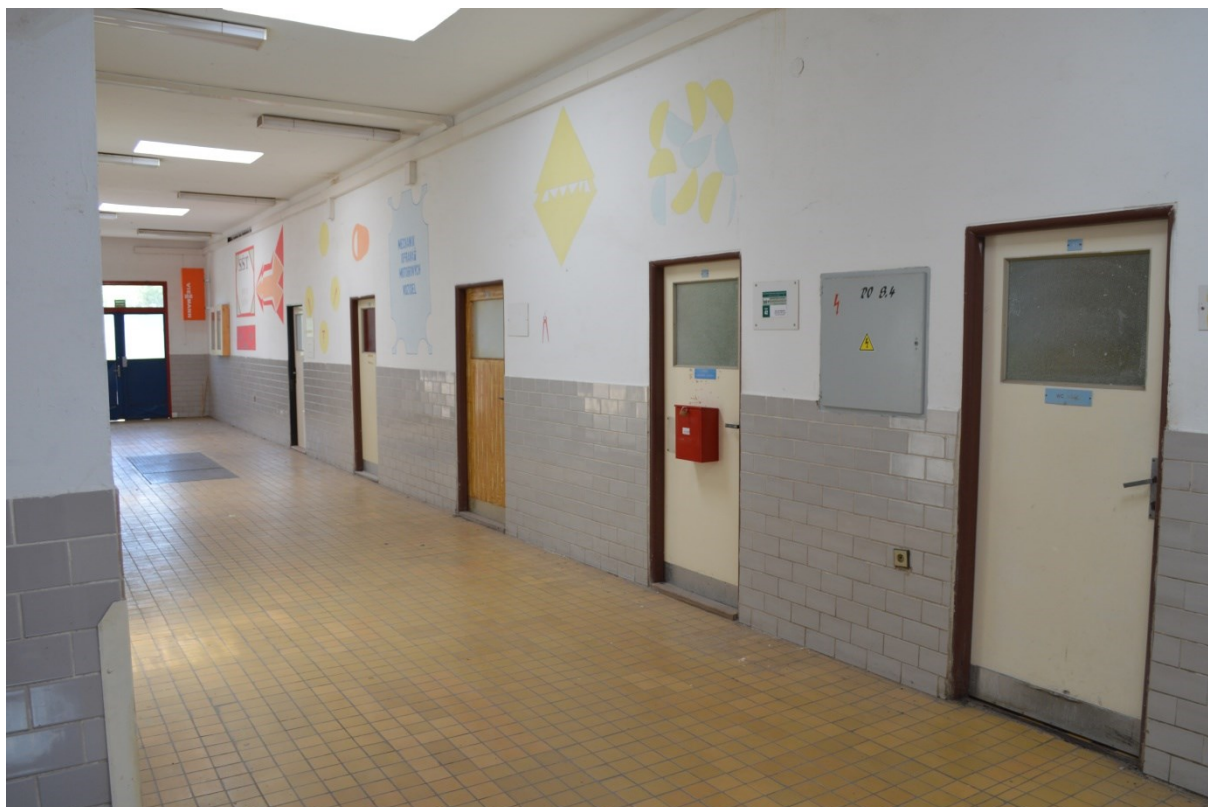
Vchody do učeben a kabinetů.