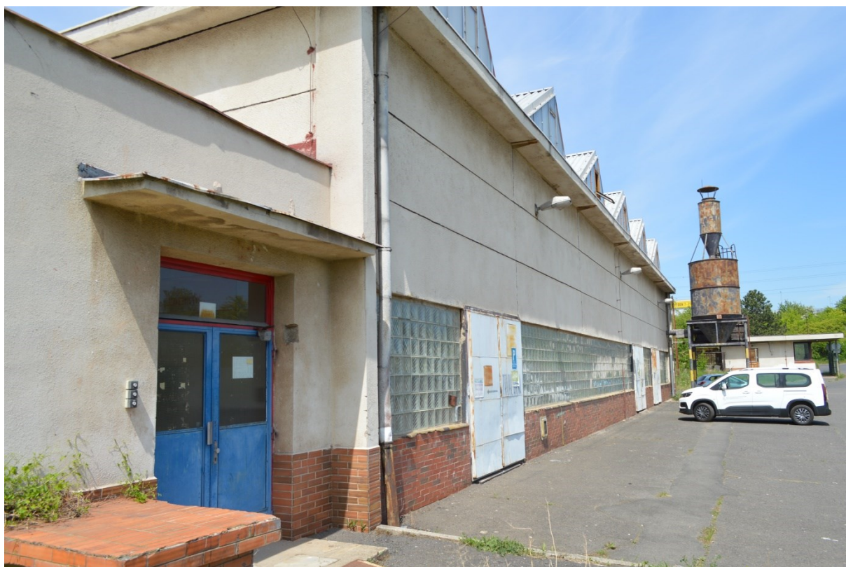
Pohled na vstup do centrální chodby a východní průčelí hal.