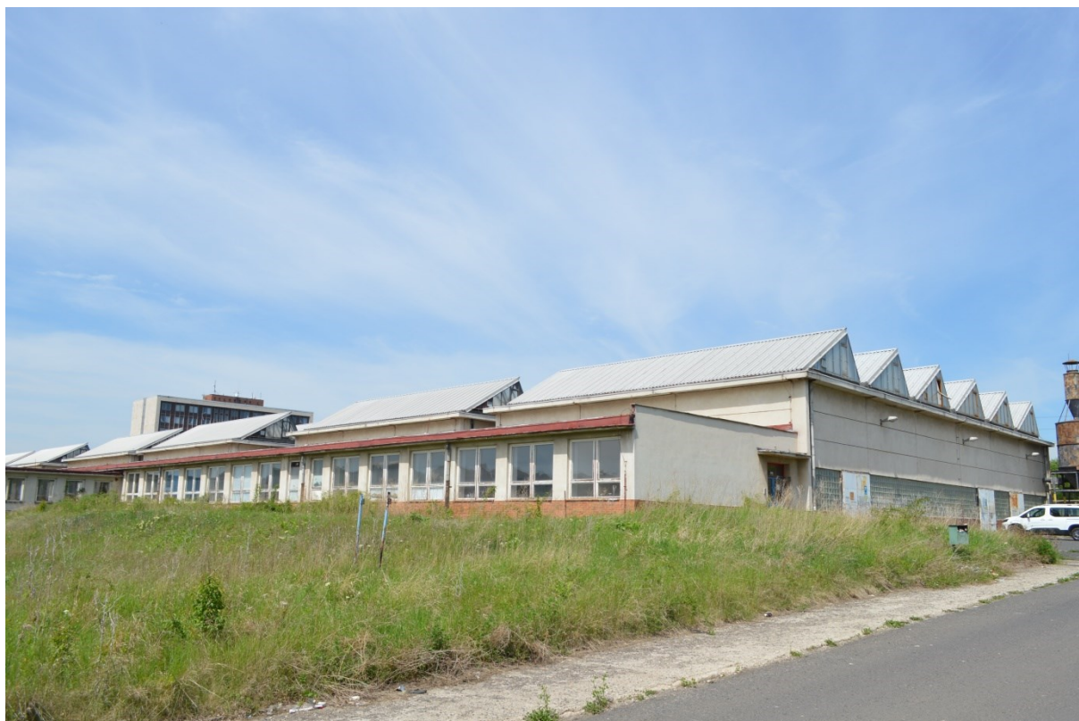
Pohled od jihu. Na prostory bývalých učeben, které lemují centrální chodbu.