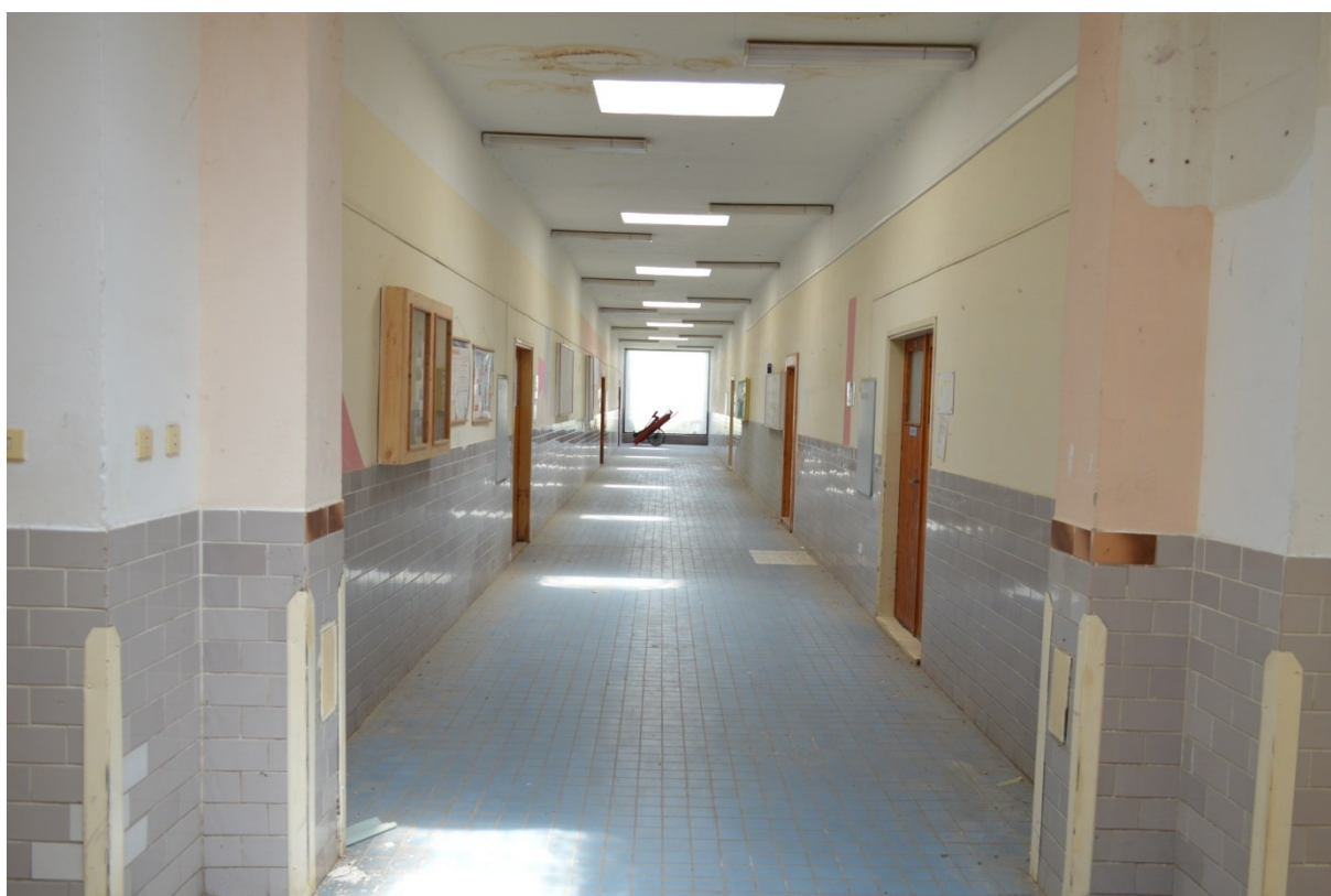
Boční chodba s vchody do jednotlivých hal.